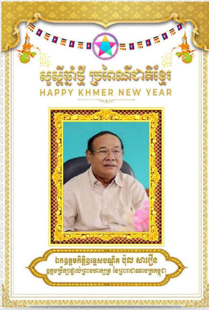
ឯកឧត្តមកិត្តិវង្សសមណ្ឌិត ប៉ុល សារឿន ឧត្តមប្រឹក្សាផ្ទាល់ព្រះមហាក្សត្រ នៃព្រះរាជាណាចក្រកម្ពុជា