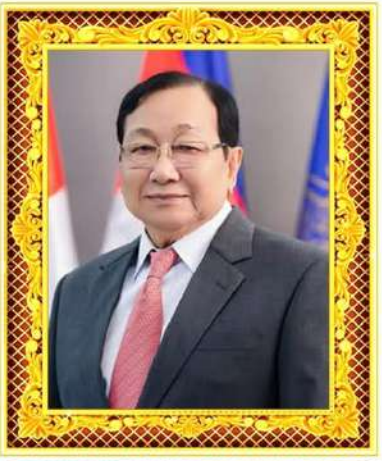
ឯកឧត្តមកិត្តិវិធីកោសលបណ្ឌិត ស៊ីត ស៊ីឡី ឧត្តមប្រឹក្សាផ្ទាល់ព្រះមហាក្សត្រ នៃព្រះរាជាណាចក្រកម្ពុជា